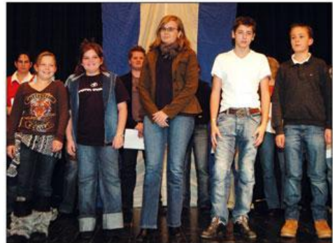
Die jungen Pecher Bogenschützen waren in nationalen und internationalen Wettkämpfen sehr erfolgreich.