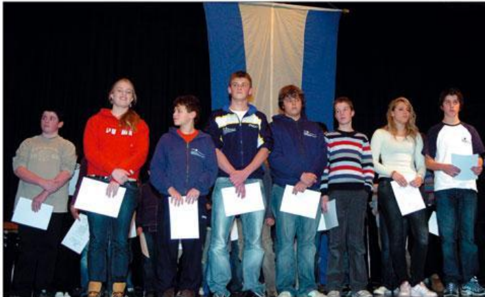
Wachtberger Schwimmer und Schwimmerinnen holten bei den DM im Mannschafts-Schwimmen den 1. Platz.

Erfolgreiche Sportler wurden in der Schulaula in Berkum von Bürgermeister Theo Hüffel mit Urkunden ausgezeichnet